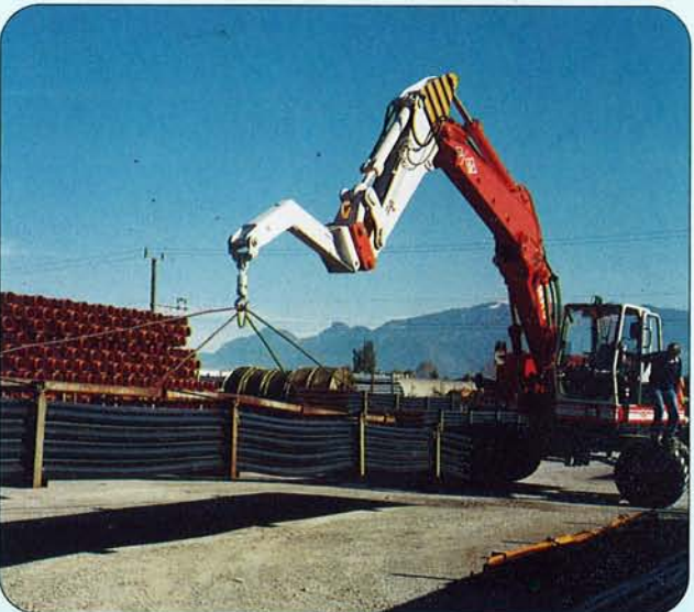
Kranarm mit Schnellwechsel-Adapter.