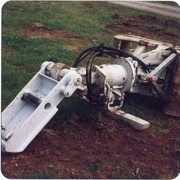
Greifer mit Schnellwechsel-Adapter.