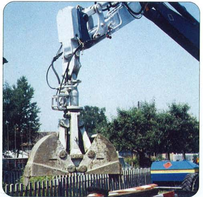
Greifer mit Schnellwechsel-Adapter.