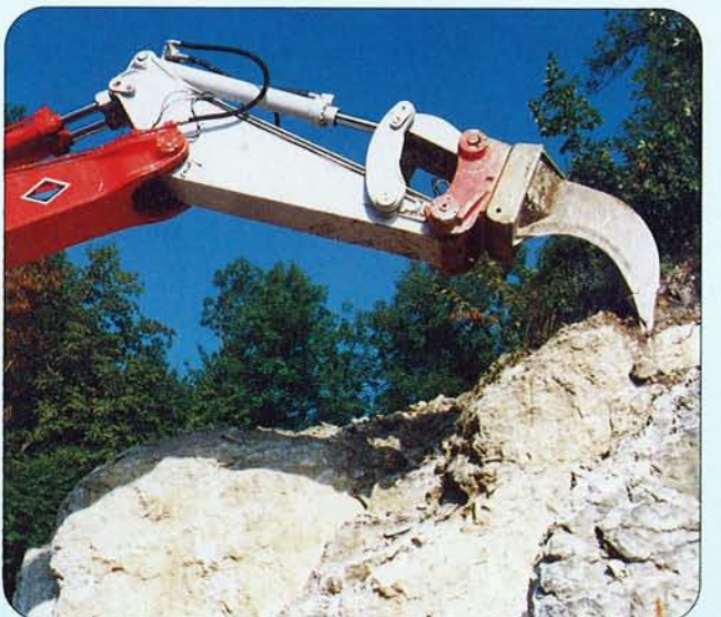
Ripperzahn mit Schnellwechsel-Adapter.