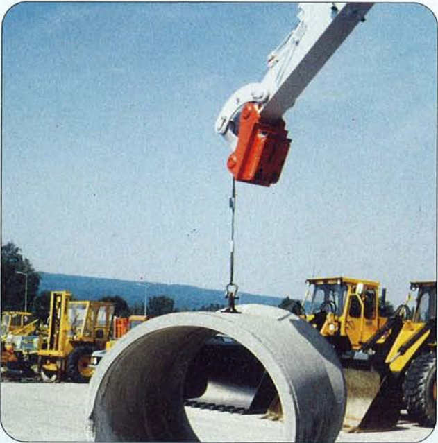
Mehr Nutzlast für Kranarbeiten, da die Arbeitsgeräte schnell abgekoppelt sind.