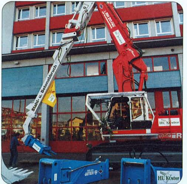
Abbrucharm starr oder teleskopierbar, befestigt mit PATENT-SCHNELLWECHSLER.