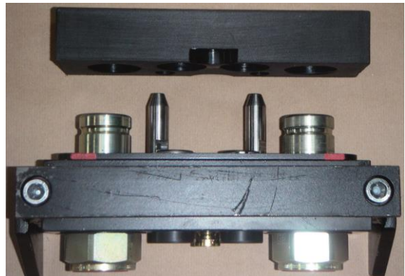
Ventilgehäuse Teil B mit Schutzdeckel